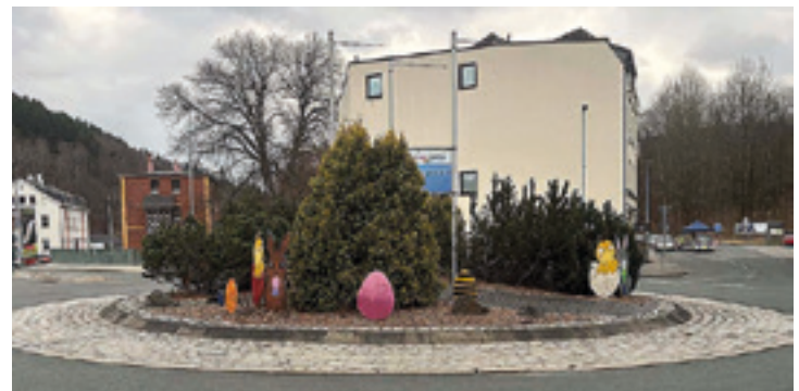
Der Osterkreisverkehr in Klingenthal

Diese Kreisverkehre dienen nicht nur der Verkehrsregelung, sondern sind auch künstlerische Wahrzeichen der jeweiligen Region. Das könnte bei uns mit Wintersport oder Musik zu tun haben. Wenn Edward mit den Scherenhänden da was kreieren könnte, wäre das nahezu genial. Vielleicht gibt es für so etwas auch Fördermittel (Identität, Bewusstsein, Zusammenhalt usw?) oder es ist was für die Bürgerstiftung. Was in dem Alpenland Sinn macht, kann auch hier nicht falsch sein. Die positiven Reaktionen auf den Osterspäß machen allemal Lust auf mehr. O. Grimm