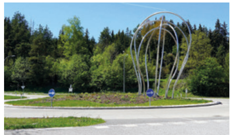
„Quirl“ Oetker Kreisverkehr in St. Martin (Villach, Kärnten)